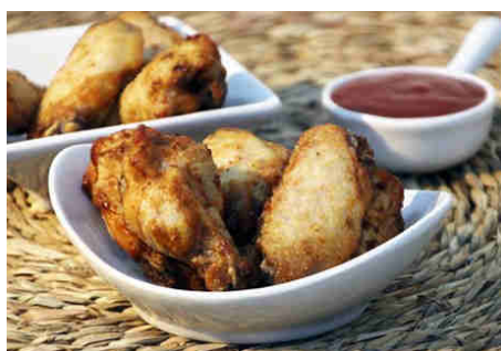
Alitas de pollo barbacoa