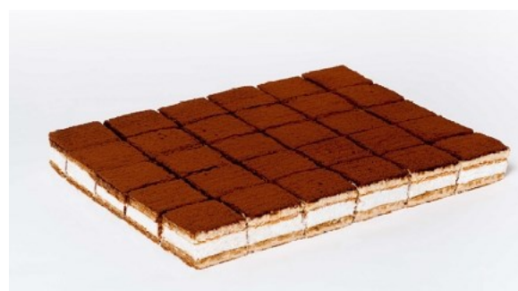
Plancha tiramisú 1,8Kg Aprox. 30 porciones