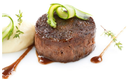
Rulo de rabo toro deshuesado