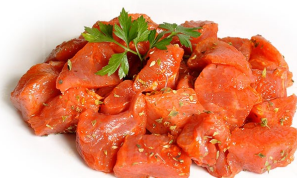
Pinchos granel Bote 1,5Kg