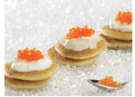
Mini blines 2x200und