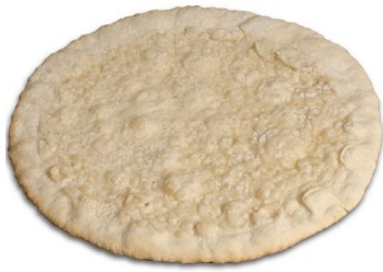
Base de pizza