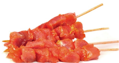
Pinchos ensartados 12 und