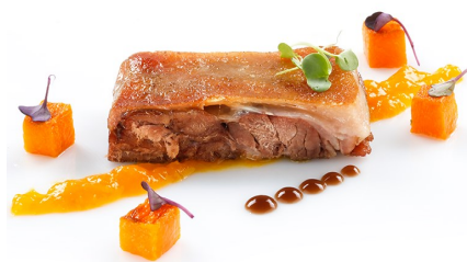
Plancha de codillo confitada