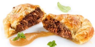
Carrillera de cerdo al hojaldre 120gr