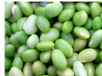
Edamame pelado 1Kg