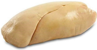
Foie extra pato