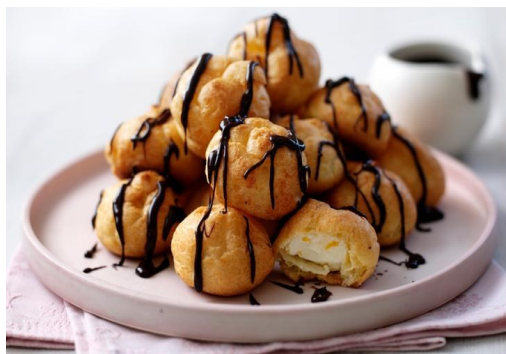
Profiteroles de nata o trufa bolsa 1Kg