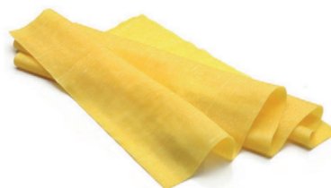
Placa de pasta Lasaña all'ouvo