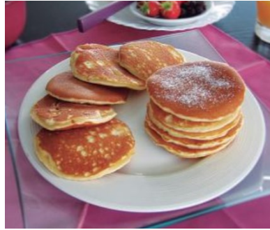
Pancake de mantequilla 80und