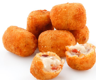
Mini croquetas de jamón ibérico Mini croquetas de cecina con piquillo Bolsa de 1kg