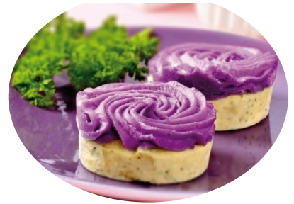
Medallón de patata con crema de violeta