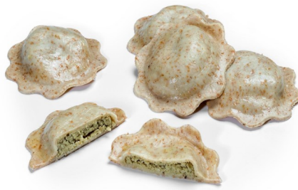
Margherita ai carciofi Bolsa de 1kg