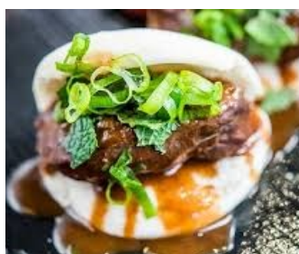
Pan bao de langosti- nos al curry