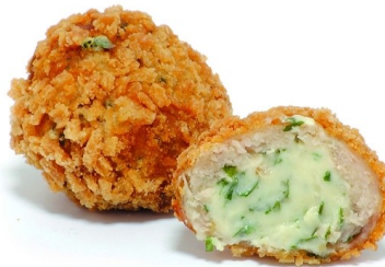
Pollo Kiev 3Kg 120 und aprox.