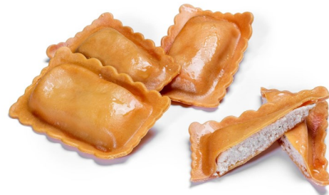
Rettangoli al salmone y ricotta Bolsa de 1kg