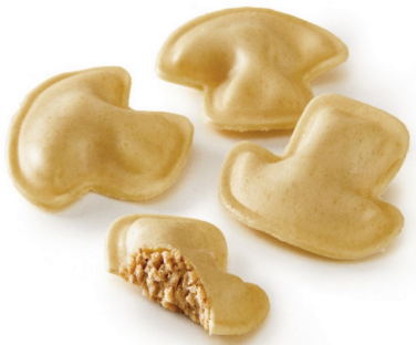
Fungo al funghi porcini Bolsa de 1kg