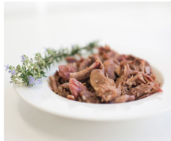
Desmigado de confit de pato