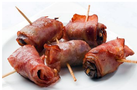
Dátiles con bacon