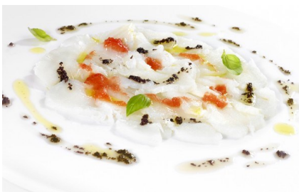
Carpacho de bacalao