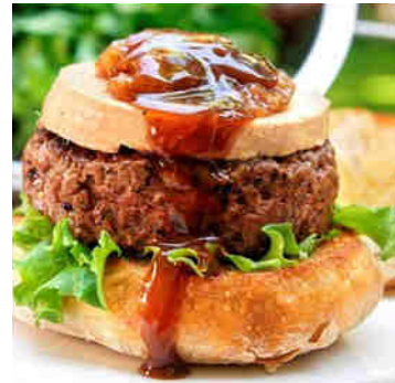
Hamburguesa de buey