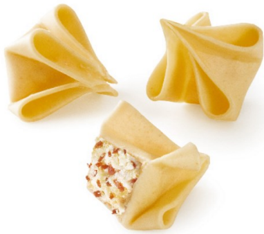
Fagottini queso manchego y jamón ibérico Bolsa de 1kg