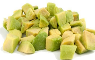
Aguacates dados 15x15 1Kg