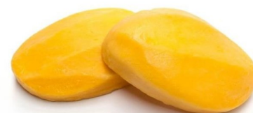
Mango mitades 24 unidades 2,7Kg