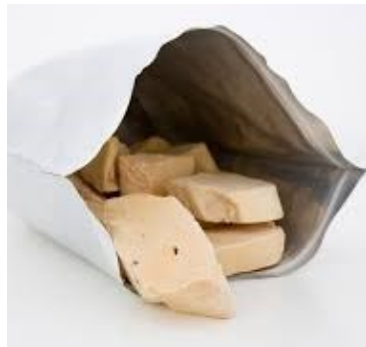
Puntas de foie de pato