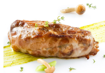
Manitas rellenas de boletus y