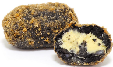
Rizqueta de arroz negro con allioli 25 gr aprox.