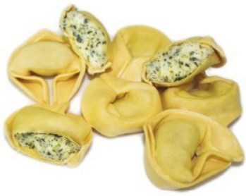
Tortellini di ricotta y espinacas Bolsa de 1kg