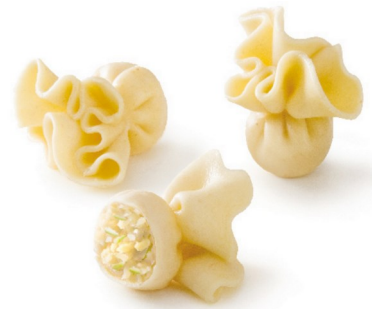
Sacchetti formaggio e pere Bolsa de 1kg