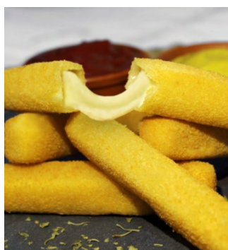
Finger queso gouda