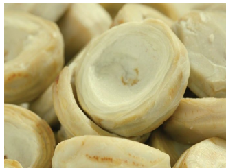
Fondos alcachofa 5/7 1Kg