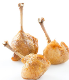
Bocaditos de codorniz pirulos