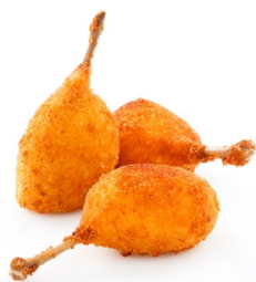
Muslitos de codorniz villarroy