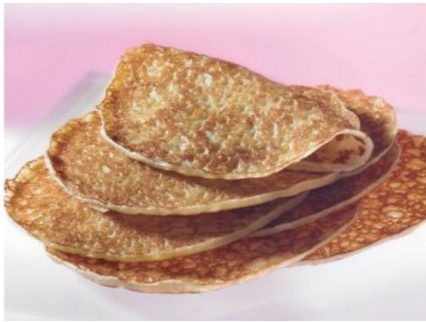
Crepes tradicionales sin azúcar 50und