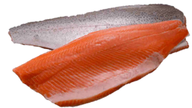
Pieza salmón Ahumado