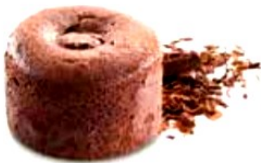
Couland chocolate 27 unidades de 110gr opción sin gluten