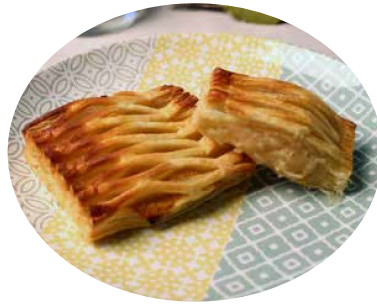
Hojaldre relleno de pescado y marisco

Masa artesanal, estirada a mano y cocida en horno de leña a la piedra