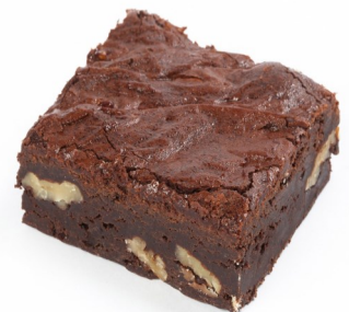
Brownie 36 und de 80gr