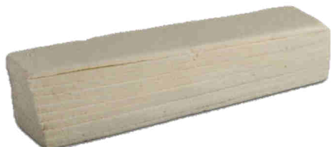
Pan molde tramezzino