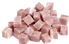
Bacon dados 1,5Kg