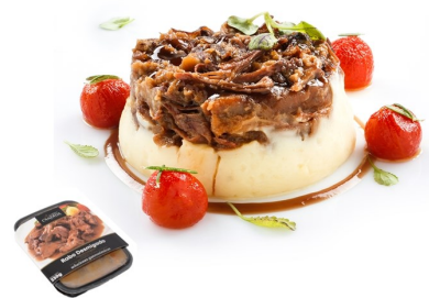
Rabo toro desmigado