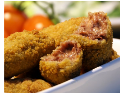
Croquetas de rabo de toro 23 gr aprox.