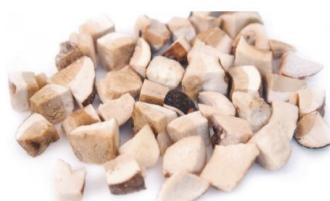
Boletus dados 1Kg Briciolini (trozos boletus) 1Kg