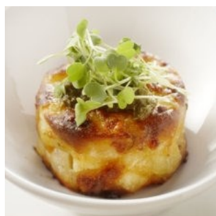
Gratin de patata y brócoli 1,5Kg