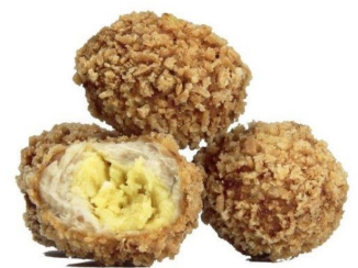
Pollo Mostaza y miel 3Kg 120 und aprox.