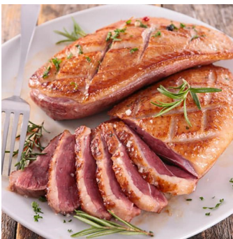
Magret de pato