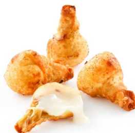
Bombas de queso con frambuesa Bombas de morcilla con piñones