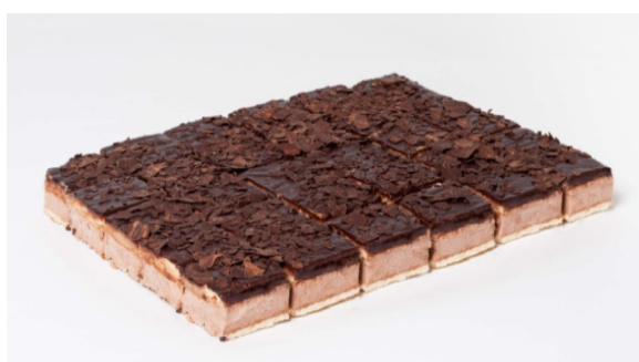
Plancha selva negra 1,8Kg Aprox. 30 porciones