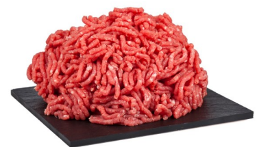
Carne picada mixta 1Kg