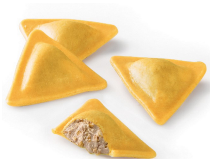
Triangoli di foie y mele Bolsa de 1kg