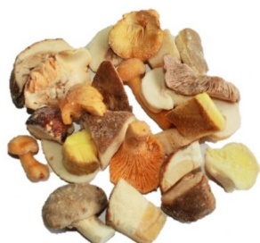
Fantasia de setas 5 tipos con boletus 1Kg