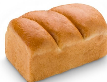
Pan de brioche molde