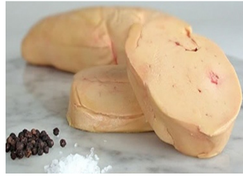
Escalope extra de pato 40/60