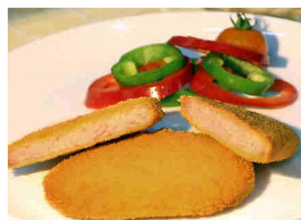
Escalopin de ternera