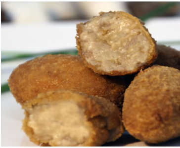
Croquetas de Boletus 23 gr aprox.