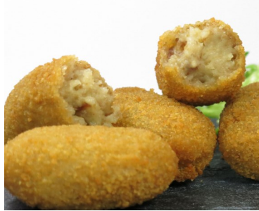
Croquetas de puchero 23 gr aprox.