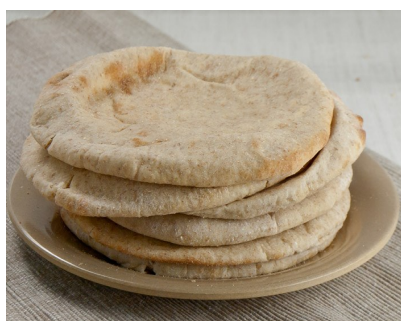
Pan de pita