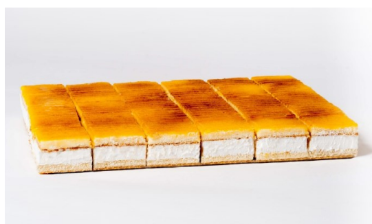
Plancha san marco 1,8Kg Aprox. 30 porciones