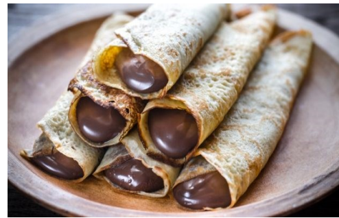
Crepes rellenos crema de cacao avellana 100x60gr