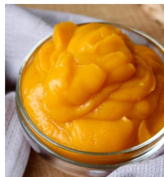
Puré de mango sin azúcar 1Kg