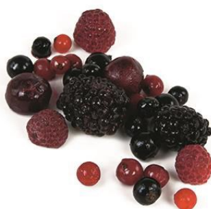
Fruta mezcla frutas del bosque 1Kg