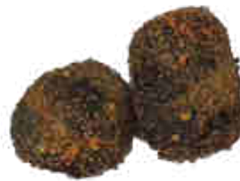
Mini croquetas de chipirones en su tinta Bolsa de 1kg