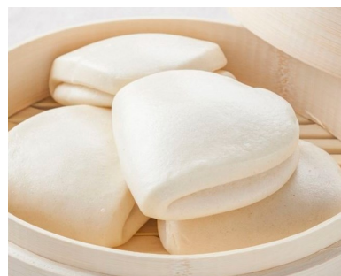
Pan Gua Bao