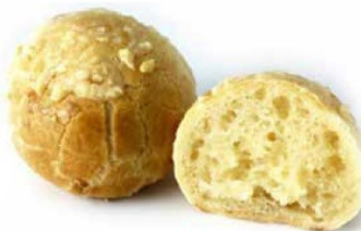
Pan de queso