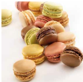
Macarrons classics 36 unidades de 12gr