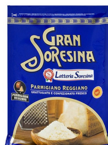
Queso parmesano polvo 1 Kg