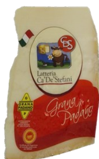
Queso parmesano Granapadano Aprox. 1 Kg