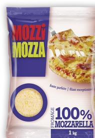
Mozzarella 100% picada 1 Kg