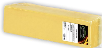
Queso barra gouda Aprox. 3Kg