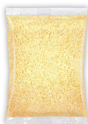
Queso rallado hostelería 1 Kg