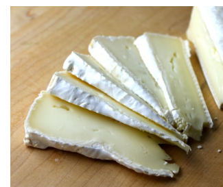
Queso Brie President 1,1Kg