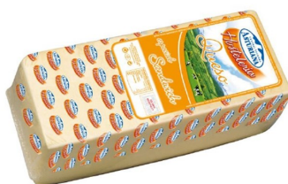
Queso barra hostelería Asturiana Aprox. 3,3 Kg