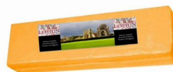
Queso Cheddar Naranja Leiston Aprox. 2 Kg