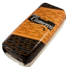
Queso Tierno Barra Mezcla Aprox. 3-3,5 Kg