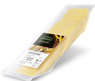
Loncheado queso barra Edam 1Kg