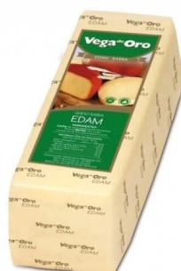
Queso Barra Edam Vega oro Aprox. 3Kg