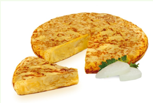
Tortilla fresca, elaborada con patata monalisa, huevo y cebolla pochada.