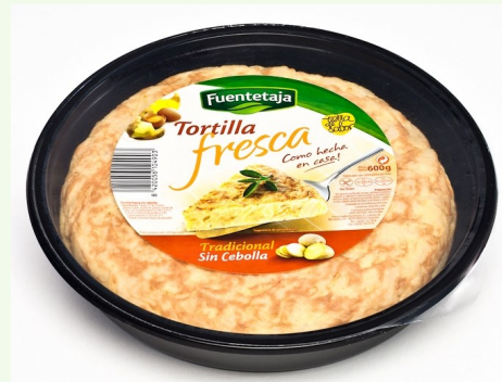
Tortilla fresca, elaborada con patata monalisa y huevo.